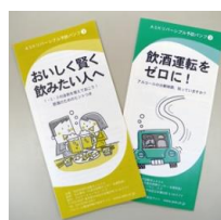
配布資料(特定非営利活動法人アスク発行)