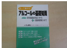
配布資料(特定非営利活動法人アスク発行)