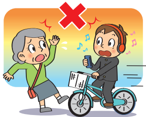
スマートフォン・イヤホン禁止