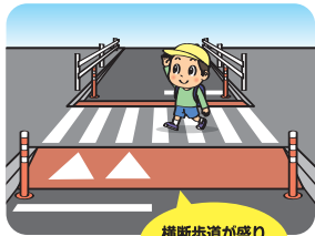
横断歩道が盛り上がっています

道路を盛り上げることで、車の速度を抑える効果があり、運転者に注意を促す効果があります。また、横断歩道を歩道と同じ高さにするので、渡りやすくなります。