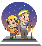
左右を確認しよう!