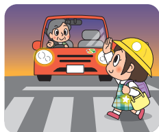
歩行者を優先しよう! 早めにライトを点灯しよう!